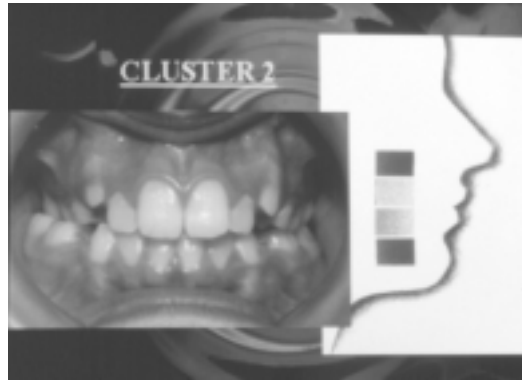
Figura 3. Fotografías y esquemas de un posible paciente incluido en el cluster 2