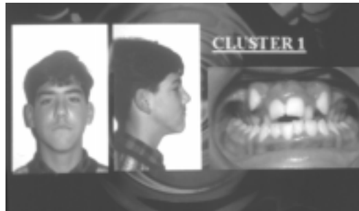
Figura 2. Fotografías de un posible paciente incluido en el cluster 1