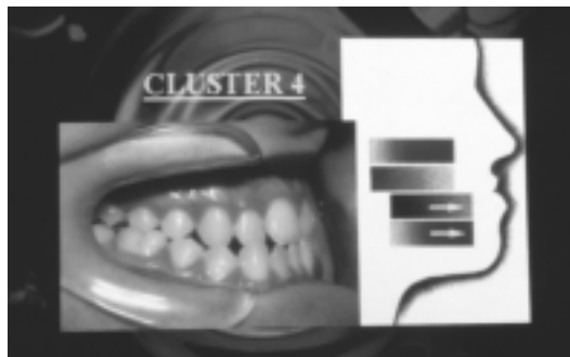
Figura 5. Fotografías y esquemas de un posible paciente incluido en el cluster 4