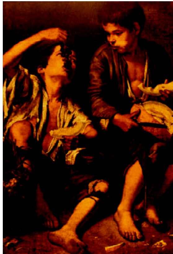
Figura 2. Murillo. "Niños comiendo frutas" (uva y pan). Hay unos versos de Ramón Bastera en "El establo" (siglos XIX-XX), que se avienen con el tema tratado: Un niño dama entonces "Hola, negra; hola, roja" y, dando con un ramo que tiene un pompón de hoja, en las ancas de los bóvidos pacienzudos, hacia los verdes prados camina, pies desnudos

... Y es que en la sabiduría popular siempre hay una frase tópica para cada ocasión, posiblemente ésta sea la gran verdad del auténtico filósofo. Dichos de contenido contradictorio son frecuentes, así, a los pies tuertos, no zapatos sino zuecos , o a los pies tuertos darles zuecos , con la intención de que actúen de calzado rígido, como ortesis de contención; se contradice con pies tuertos, no han menester zuecos . Dichos que ya aparecen en las colecciones del año 1560. La palabra refrán, tiene su origen en el idioma galo ( refrain ) y es de común aceptación en tierra hispa-