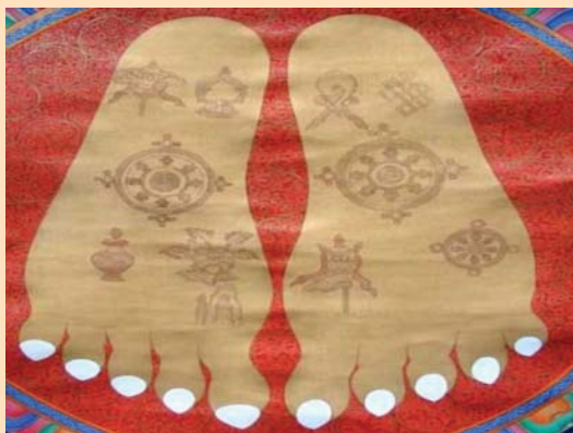
Figura 4. Dorso de los pies de Buda