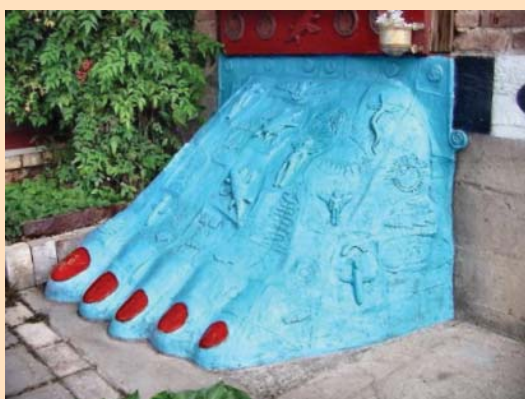
Figura 5. Los pies de Buda son venerados