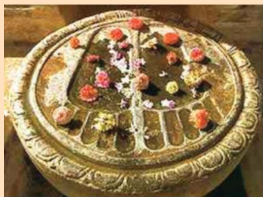
Figura 2. Huellas sagradas de Buda