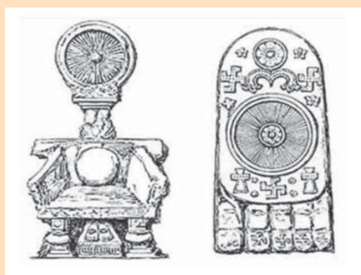
Figura 7. Buda representado por el trono y por su pie

y el cuerpo, a su vez, es un elemento de un universo de entidades interrelacionadas. Por lo tanto la enfermedad no se puede definir fuera del individuo, y la enfermedad o desequilibrio será diferente en cada cuerpo o individuo, porque hay que tener en cuenta las relaciones de ese cuerpo con el universo. Más que una búsqueda de causas externas es una contextualización del cuerpo en el universo. Para el antropólogo Joseph Needham el pensamiento chino no busca tanto la relación causa efecto como el occidental, sino que considera que los fenómenos relacionados son sincrónicos o están emparejados emblemáticamente.