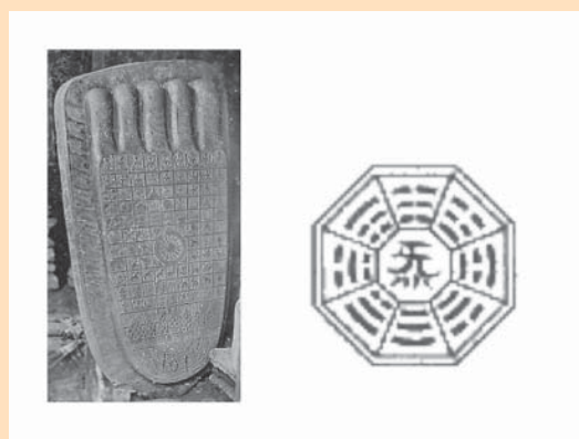
Figura 1. Hexagrama para la adivinación. Kan son los pies

En la enfermedad no está alterado el cuerpo material sino el ser humano total, en su ambiente. Es que en la concepción de la medicina china, el holismo tiene un alto significado por lo cual todas las partes del cuerpo de una persona están interrelacionadas,