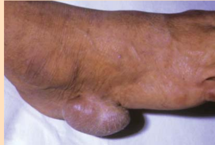
Imagen de tumor sudoral benigno, cuyo tratamiento es la resección quirúrgica.