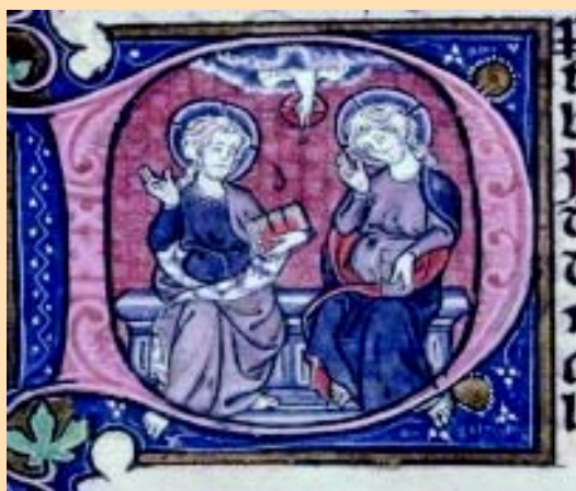
Figura 2. "Trinidad" Miniatura en "Biblia Latina". Biblioteca Municipal de Lyon S. XIII