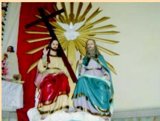
Figura 6. "Santísima Trinidad" Arte Popular. Iglesia de Santa Teresita del Niño Jesús (México)

avisa a cada uno de ellos de todo lo que le acontecerá en los tiempos venideros. Hecho esto, da las disposiciones pertinentes sobre dónde deben enterrarlo y "cuando Jacob hubo terminado de dar estas instrucciones a sus hijos, recogió sus pies en la cama y expiró" (Gn.49, 33). Jacob recoge los pies, la parte del cuerpo que le pone en contacto con la tierra, y simboliza el momento en que muere para los hombres, pero no su espíritu, que pervivirá en sus doce hijos (las doce tribus de Israel).