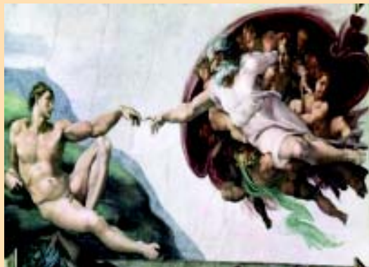
Figura 1. "La creación de Adán" de Miguel Ángel. Capilla Sixtina (Vaticano) S. XVI