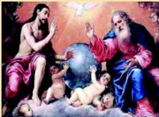
Figura 4. "Santa Trinidad" Antonio de Pereda. Museo de Artes. Budapest