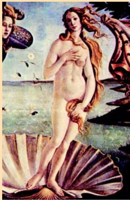
Figura 4. BOTICELLI. "El nacimiento de Venus". Su obra es relevante de un goticismo tardío. Maestro de los ínfimos detalles. Venus nace de una concha marina y sus pies parecen dos perlas, aunque algo barrocas. Fijándonos, el derecho parece plano valgo y el izquierdo es muy cavo

El cuadro muestra el inicio de la transformación, de la planta del pie izquierdo van saliendo raíces.