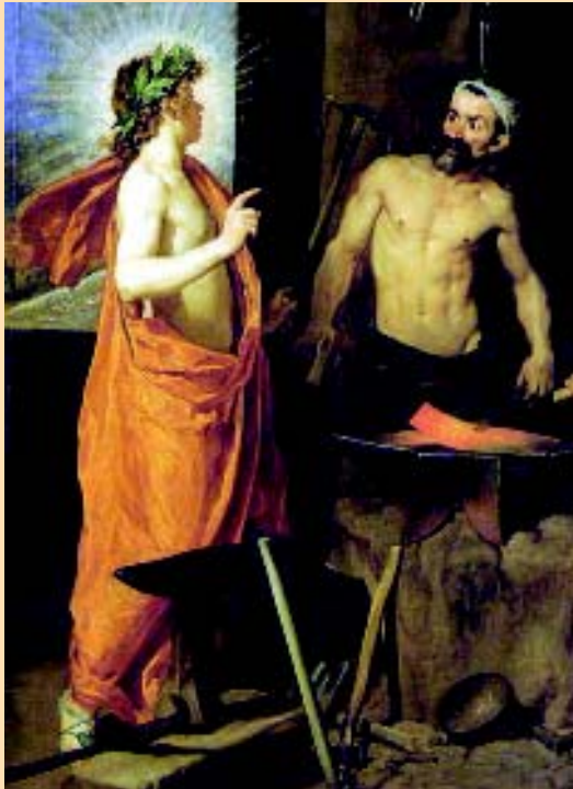
Figura 2. VELAZQUEZ. "La fragua de Vulcano". Apolo se aparece a Vulcano o Hefastos, dios del fuego, para notificarle que su esposa Venus se acuesta con Marte. Vulcano en su fragua le mira sorprendido, llama la atención su aspecto escoliótico y báscula pélvica debido a dismetría de extremidades inferiores. Un buen trío olímpico. Venus casquivana, Marte aprovechado y Apolo un buen amigo que se lo cuenta...

ses; Zeus rey de los Titanes construyó en ella una palacio. Allí se encuentra un altar dedicado a él mismo, Júpiter latino 2 , lugar donde los sacrificios animales realizados permanecen incorruptos. Su culto era el más extendido y su nombre el más respetado. La parte más elevada es denominada Pitio y en ese sitio es adorado Apolo.