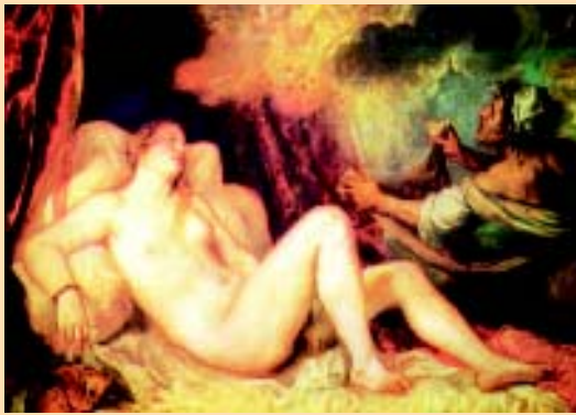
Figura 1. TIZIANO. "Danae y la lluvia de oro". Aquí Zeus o Júpiter, se transforma en lluvia de oro para atravesar la prisión en que estaba encerrada la princesa por su padre. Así se demuestra que el amarillo metal todo lo puede. De la relación nació en esforzado Perseo