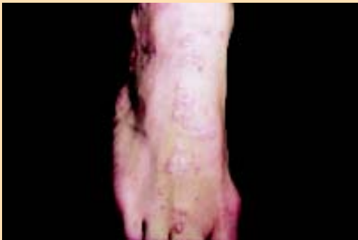
Imagen de líquen plano

El líquen plano es una enfermedad poco común que causa erupción o lesión inflamatoria y picazón recurrentes en la piel o en la boca. No se conoce la causa exacta de esta enfermedad, pero es probable que esté relacionada con una reacción alérgica o inmune.